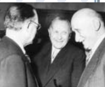
Alcide de Gasperi, Konrad Adenauer, Robert Schuman